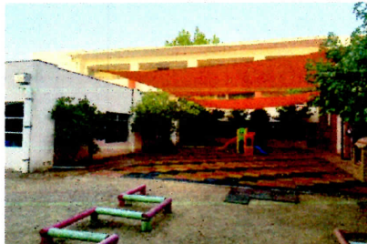
Arreglo patio Educación Parvularia