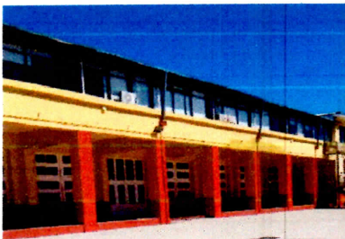
Pintura fachada interior